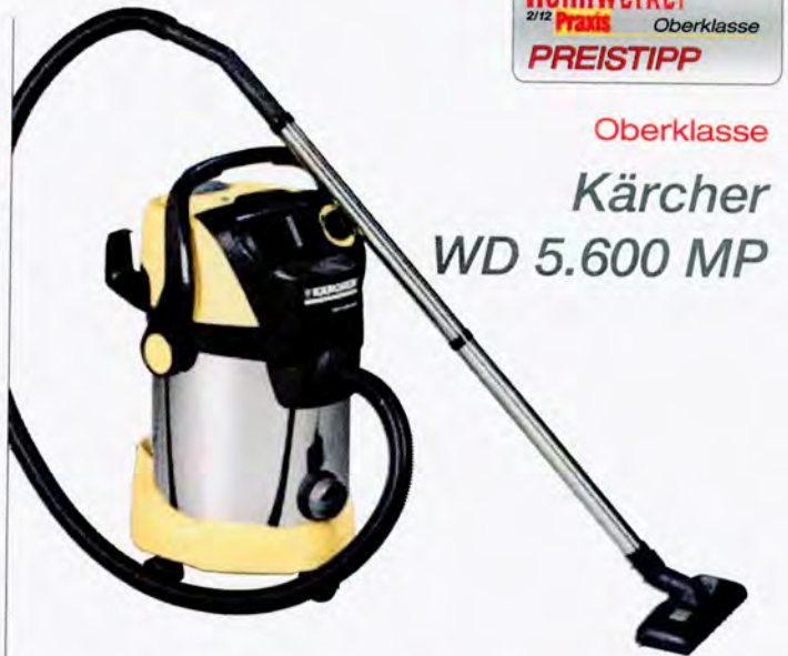
Oberklasse Kärcher WD 5.600 MP

Reinigungsspezialist Kärcher schickt ein Gerät der Oberklasse. Unsere hochgesteckten Erwartungen erfüllt das Gerät voll.