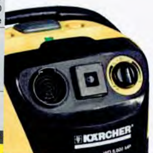
Beim Kärcher lässt sich als einzigem Gerät des Testfeldes die Saugkraft stufenlos regulieren