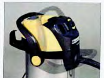
Um die Motoreinheit abzunehmen, wird einfach der Handgriff umgelegt. Das ist deutlich praktischer, als die sonst üblichen zwei Verriegelungen zu lösen

Der Universalist der Oberklasse punktet besonders mit hoher Saugleistung und komfortabler Bedienung. Und setzt sich damit auf Platz zwei, wobei er den Preistipp einheimst.