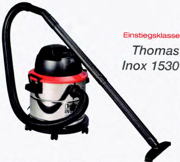
Einstiegsklasse Thomas Inox 1530

Heimwerker 2/12 Praxis Oberklasse PREISTIPP