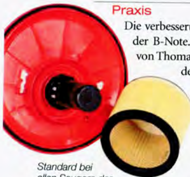
Standard bei allen Saugern des Testfeldes sind runde Faltenfilter

Wer einen Sauger vornehmlich zum Saugen sucht, ist mit dem Modell von Thomas bestens bedient schafft es trotz der mäßigen Ausstattung auf den zweiten Platz in der Einstiegsklasse.