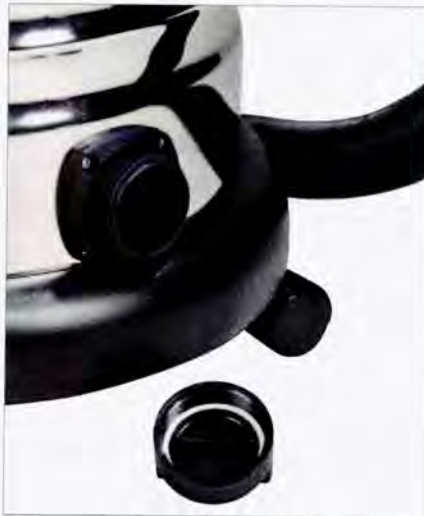
Die Sauger von Einhell, EWT und Kärcher haben eine Ablassöffnung für Flüssigkeiten im Kessel

Sämtliche Modelle des Testfeldes sind mit einem Füllstandsschalter ausgerüstet, der den Sauger abschaltet, bevor das Wasser im Saugbehälter den Motor flutet. Für Flüssigkeiten besonders gut geeignet sind die Geräte mit Edelstahl-Kesseln, da die sich gut wieder reinigen lassen. Praktisch ist eine zusätzliche Öffnung unten im Kessel, über die Flüssigkeiten abgelassen werden können, ohne dass man den Sauger öffnen und umkippen muss. Einhell, EWT und Kärcher warten mit diesem Feature auf.