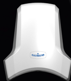
AirStar T-C1 Series 100

Im Jahr 1925 entwickelt und produzierten wir den weltweit ersten Warmlufthändetrockner. Unsere Hand- und Haartrockner sind das Resultat aus diesen 96 Jahren Know-How - so auch der AirStar T-C1 100. Mit dem Retro-Logo ELECTROSTAR erinnern wir uns noch einmal zurück an unsere Anfänge.