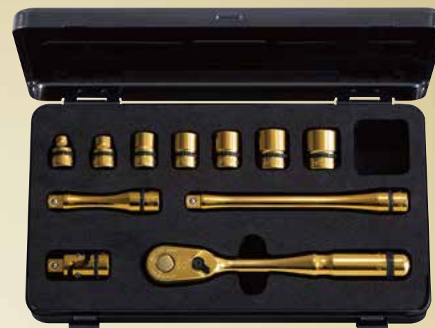
nepros 9.5sq.ソケットレンチセット iPゴールド [11点] No.NTB311AZGL 標準小売価格 ¥41,000 セット内容／[iPゴールド仕様]9.5sq.ソケット(六角)、9.5sq.ラチェットハンド ル、9.5sq.エクステンションバー、9.5sq.ユニバーサルジョイント／[ツール ケース]片開きメタルケース(NEKB-1)