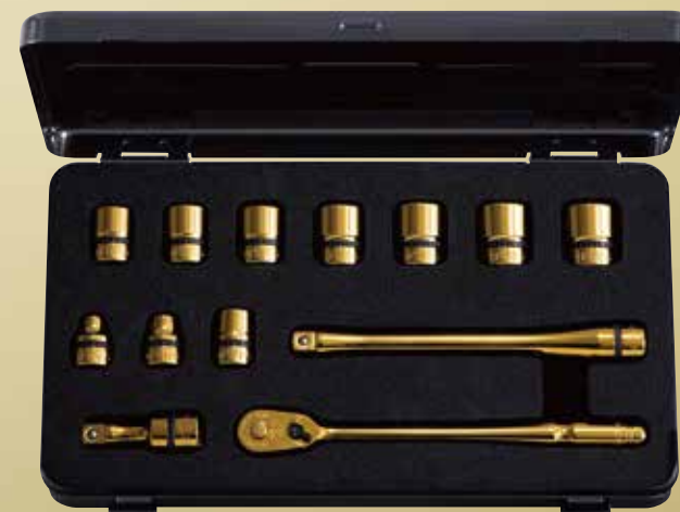
nepros 9.5sq.ソケットレンチセット iPゴールド [13点] No.NTB313GZGL 標準小売価格 ¥38,000 セット内容／[iPゴールド仕様]9.5sq.ソケット(六角)、9.5sq.コンパクトロン グラチェットハンドル、9.5sq.エクステンションバー／[ツールケース]片開き メタルケース(NEKB-1)