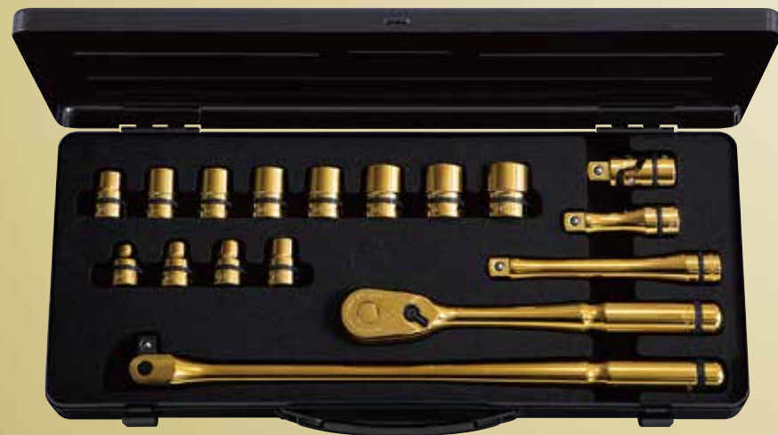
nepros 12.7sq.ソケットレンチセット iPゴールド [17点] No.NTB417GZGL 標準小売価格 ¥84,600 セット内容／[iPゴールド仕様] 12.7sq.ソケット(六角) [サイズ:10,12,13,14,15,16,17,18,19,21,22,24mm]、12.7sq.ラチェットハンドル、12.7sq.スピナハンドル、12.7sq.エクステンションバー、12.7sq.ユニバーサルジョイント／[ツールケース]片開きメタルケース (NEKB-2)