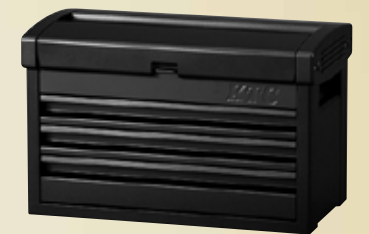
EKR-103N iPゴールド用特別色