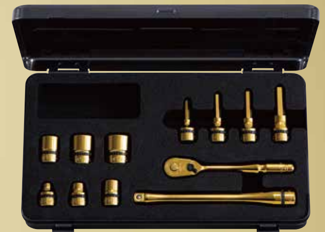
nepros 9.5sq.ソケットレンチセット iPゴールド [12点] No.NTB312GZGL 標準小売価格 ¥41,000 セット内容／[iPゴールド仕様]9.5sq.ソケット(六角)、9.5sq.コンパクトラ チェットハンドル、9.5sq.エクステンションバー、9.5sq.ヘキサゴンビットソ ケット／[ツールケース]片開きメタルケース(NEKB-1)