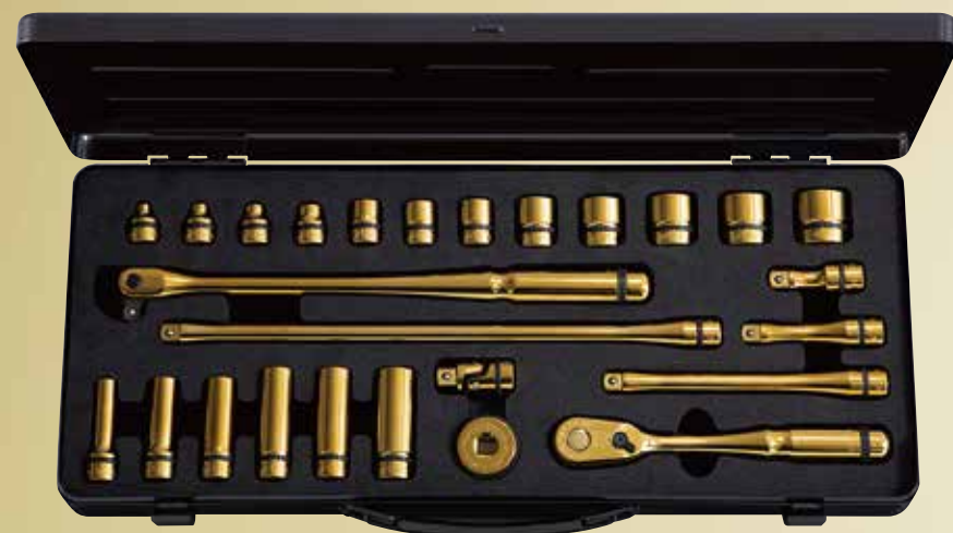
nepros 9.5sq.ソケットレンチセット iPゴールド [26点] No.NTB3X26AZGL 標準小売価格 ¥83,900 セット内容／[iPゴールド仕様]9.5sq.ソケット(六角)、9.5sq.ディープソケット(六角)、9.5sq.ラ チェットハンドル、9.5sq.スピナハンドル、9.5sq.エクステンションバー、9.5sq.クイックスピン ナ、9.5sq.ユニバーサルジョイント／[ツールケース]片開きメタルケース(NEKB-2)

充実の入組から厳選された入組の5タイプで、 iPゴールドの輝きを様々なシーンで体験できる9.5sq.ツールセット。