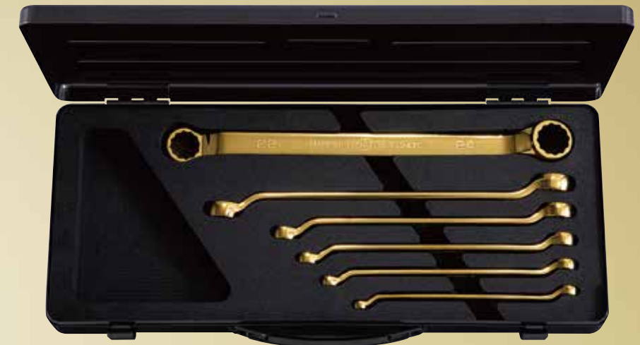
nepros 45°×6°めがねレンチセット iPゴールド [6点] No.NTM506GL 標準小売価格 ¥45,800 セット内容／[iPゴールド仕様] 45°×6°めがねレンチ／[ツールケース]片開きメタルケース (NEKB-2)

小さな面取り角度とパワーフィット形状により、ボルト・ナットにジャストフィット。 極小レンチ外径や手に優しい側面形状など、細部までこだわったレンチセット。