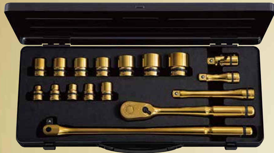
nepros 12.7sq.ソケットレンチセット iPゴールド [17点] No.NTB417AZGL 標準小売価格 ¥89,000 セット内容／[iPゴールド仕様] 12.7sq.ソケット(六角) [サイズ:10,12,13,14,17,19,21,22,24,27,30,32mm]、12.7sq.ラチェットハンドル、12.7sq.スピナハンドル、12.7sq.エクステンションバー、12.7sq.ユニバーサルジョイント／[ツールケース]片開きメタルケース (NEKB-2)

ついに12.7sq.でiPタイプが登場。 異なるソケットサイズの入組で大型車や重機、輸入車に最適。