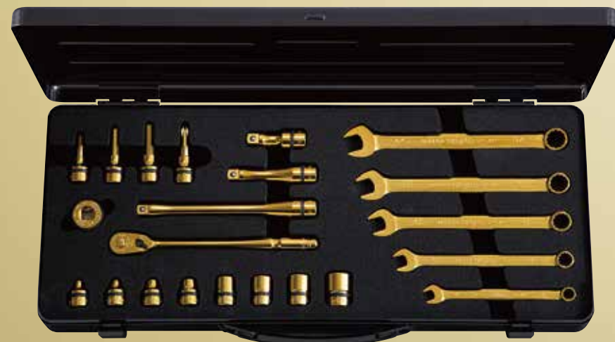
nepros 9.5sq.ツールセット iPゴールド [22点] No.NTX3CX22GL 標準小売価格 ¥80,000 セット内容／[iPゴールド仕様]9.5sq.ソケット(六角)、9.5sq.コンパクトロングラチェットハンド ル、9.5sq.エクステンションバー、9.5sq.コンパクトクイックスピナ、9.5sq.ヘキサゴンビットソ ケット、9.5sq.クロスビットソケット、コンビネーションレンチ／[ツールケース]片開きメタルケー ス(NEKB-2)