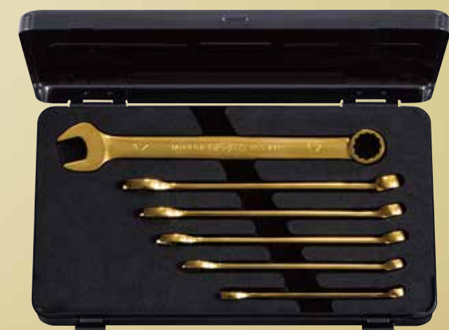
nepros コンビネーションレンチセット iPゴールド [6点] No.NTMS206ZGL 標準小売価格 ¥38,400 セット内容／[iPゴールド仕様] コンビネーションレンチ／[ツールケース]片開きメタルケース (NEKB-1)